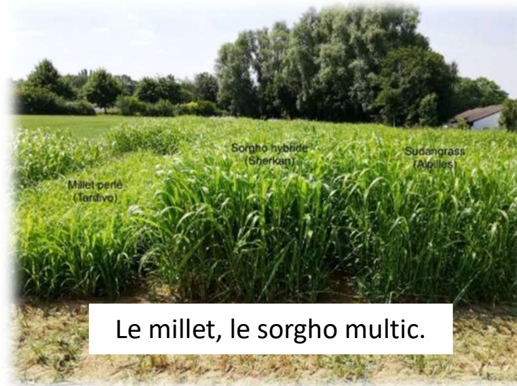
Le millet, le sorgho multïc.