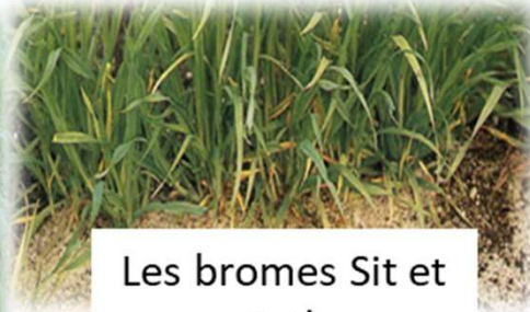
Les bromes Sit et Cath