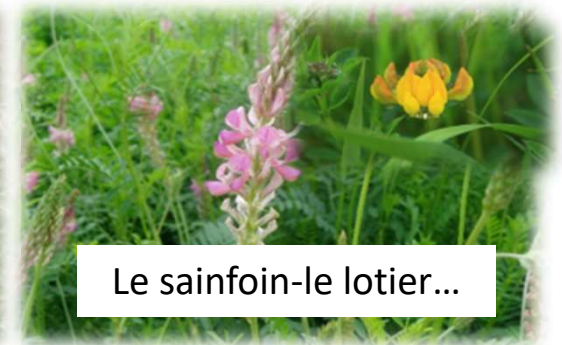
Le sainfoin-le lotier...