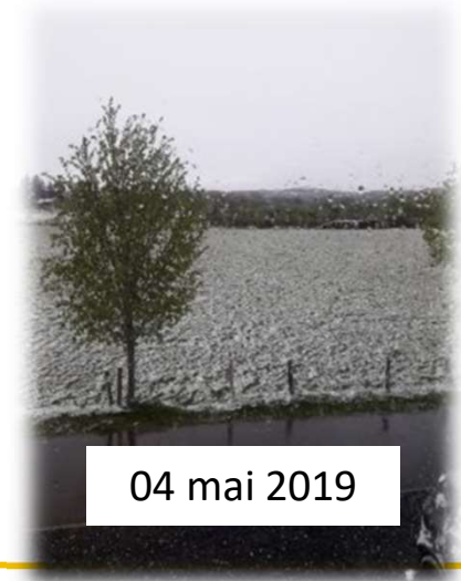
04 mai 2019