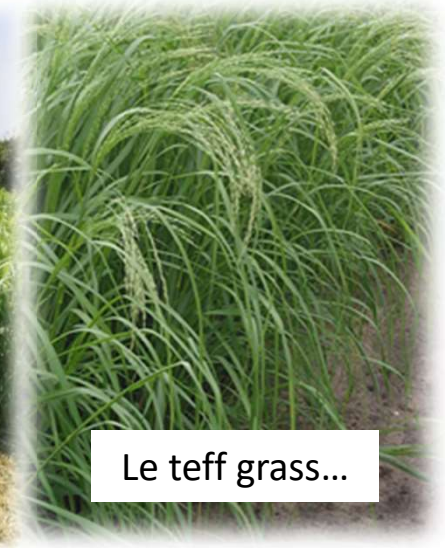
Le teff grass...